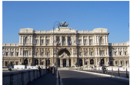
Het Justitiepaleis in Rome.