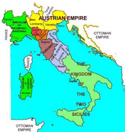
Italië in 1848

De architect van het Risorgimento was de uit Piëmont-Sardinië afkomstige Camillo Benso di Cavour (1810-1861). Dit noordwestelijk gelegen koninkrijkje bezat een enorm economisch en militair overwicht ten opzichte van de andere delen van het Italiaans schiereiland. Het was dan ook niet meer dan logisch dat Victor Emanuel II (1820-1878) van Piëmont-Sardinië op 17 maart 1861 tot koning van Italië gekroond werd.