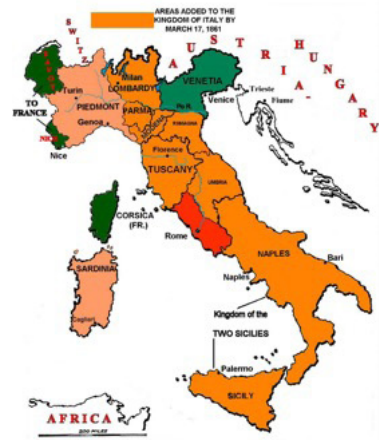
Italië in 1861. Het nieuwe koninkrijk (roze) verliest wat gebieden (groen), maar weet een hoop toe te voegen (oranje). De overige gebieden (rood en blauwgroen) volgen in 1870.

Verdi was zelf een nationalist van het eerste uur en zag het als zijn plicht het sentiment van Risorgimento met zijn composities te voeden. Een mooi voorbeeld is de volgende strofe die in de opera La Battaglia di Legnano (Rome, 1849) wordt uitgesproken: